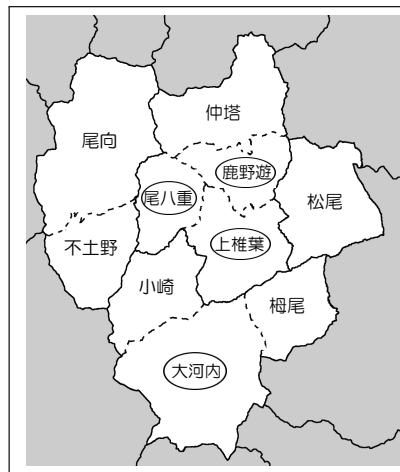
図1: 上椎葉・尾八重・鹿野遊・大河内の位置

本報告書では、大字下福良上椎葉区の方言（以下、上椎葉方言）、大字下福良尾八重区の方言（以下、尾八重方言）、大字下福良鹿野遊区の方言（以下、鹿野遊方言）、及び大字大河内大河内区の方言（以下、大河内方言）の調査結果を報告する。4つの地点の地理的な位置を地図で示すと、次のとおりである（図1）。