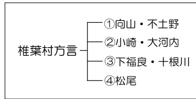
図 2: 吉岡（1994）に基づき筆者が作成した椎葉村方言の区画

しかし、木部・他（編）（2016, 2017, 2018）といった先の報告書で触れられている通り、この4つの区画では、椎葉村内の方言差は捉えきれない。従って、2014年度から行われている椎葉村と国立国語研究所の合同調査では、調査地点を合計13地点設けた。13地点の内訳は、向山日当、尾手納、向山日添、小崎、不土野、榎尾、仲塔、松尾、上椎葉、大河内、鹿野遊、尾八重（以上、調査順）、および尾前である。尾前を除く12地点で共通の基礎語彙調査を行い、尾前では語彙調査を含む総合的な文法調査を行っている。本報告書は13地点のうち、冒頭で述べた通り、上椎葉方言・尾八重方言・鹿野遊方言（吉岡の言う下福良）と大河内方言の基礎語彙調査の報告書である。