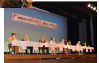
危機言語・方言サミット(与論)