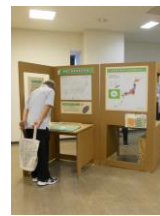
モバイル型展示ユニット

各地でモバイル型展示ユニットを使った展示を行っています。文化庁と協力して毎年「危機言語・方言サミット」を開催しています。