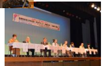
危機言語・方言サミット(与論)

各地でモバイル型展示ユニットを使った展示を行っています。文化庁と協力して毎年「危機言語・方言サミット」を開催しています。