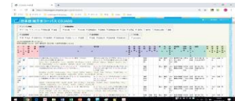
日本語諸方言コーパス(COJADS) https://chunagon.ninjal.ac.jp/cojads/search

人間文化研究機構広領域連携型プロジェクト「日本列島における地域社会変貌・災害からの地域文化の再構築」