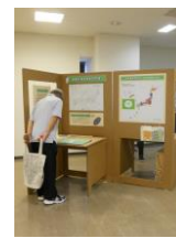
モバイル型展示ユニット

宮崎県椎葉村, 愛知県木曾川町, 青森県むつ市, 八戸市などで、地域の人たちと協力して、方言の合同調査を行っています。全国の大学生・大学院生が公募により参加します。