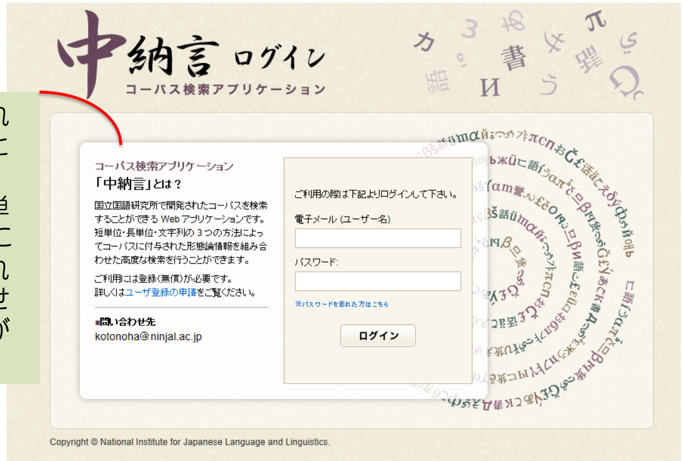
図1 『中納言』 ログイン画面 (利用には申請が必要, 無料)

国立国語研究所で開発されたコーパスを検索することができる Web アプリケーションです。短単位・長単位・文字列の3つの方法によってコーパスに付与された形態論情報を組み合わせた高度な検索を行うことができます。